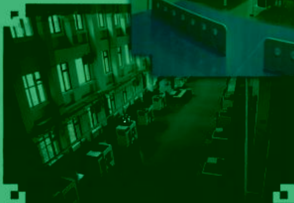
DMC 数控技术 训练场所